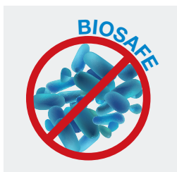
Hygiène et maîtrise de la prolifération bactérienne