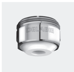
Sortie de bec BIOSAFE