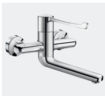
Mitigeur mécanique séquentiel mural Bec fixe / orientable L.200 Réf. DELABIE : 2641