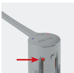
Fonction choc thermique