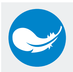
Ergonomie et fonctionnalités améliorées