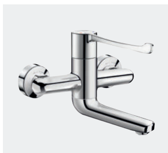
Mitigeur mécanique séquentiel mural Bec fixe / orientable L.120 Réf. DELABIE : 2640

Illustrations disponibles sur notre site internet delabie.fr , rubrique Presse