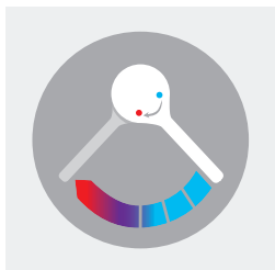
Ouverture et fermeture séquentielles sur l'eau froide

Le seul mitigeur séquentiel mural du marché avec fonction choc thermique sans démontage de la manette