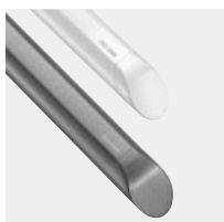
Barres de maintien anthracite métallisé ou blanches