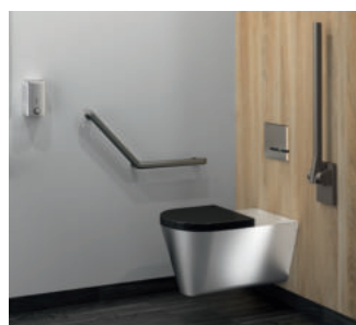
Exemple d'installation barre de maintien rabattable Réf. 511964C