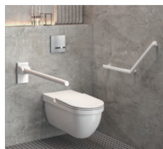
Exemple d'installation barre de maintien rabattable Réf. 511964W

Le PLUS X AWARD est le plus grand prix d'innovation au monde dans les domaines de la technologie, du sport et du mode de vie. Il récompense les marques qui se distinguent par la qualité et l'innovation de leurs produits. Un jury d'experts indépendants, représentant différents secteurs d'activité, attribue les labels de qualité du prix d'innovation : Innovation, Design, Haute qualité, Facilité d'utilisation, Fonctionnalité, Ergonomie et Écologie. Cette approche du PLUS X AWARD est unique. Ainsi, les labels de qualité du PLUS X AWARD constituent une référence des meilleurs produits et un signe indéniable de la qualité d'une marque.