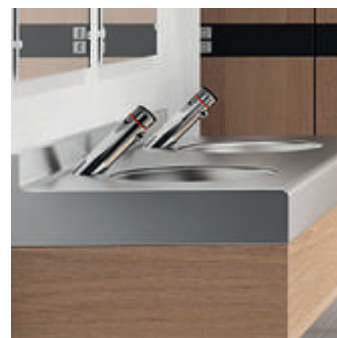
Mitigeur temporisé de lavabo TEMPOMIX 3

Le mode affluence réduit le rinçage lors de successions d'utilisateurs : un compromis entre hygiène et consommation d'eau. Réf. DELABIE : 430SBOX-430030