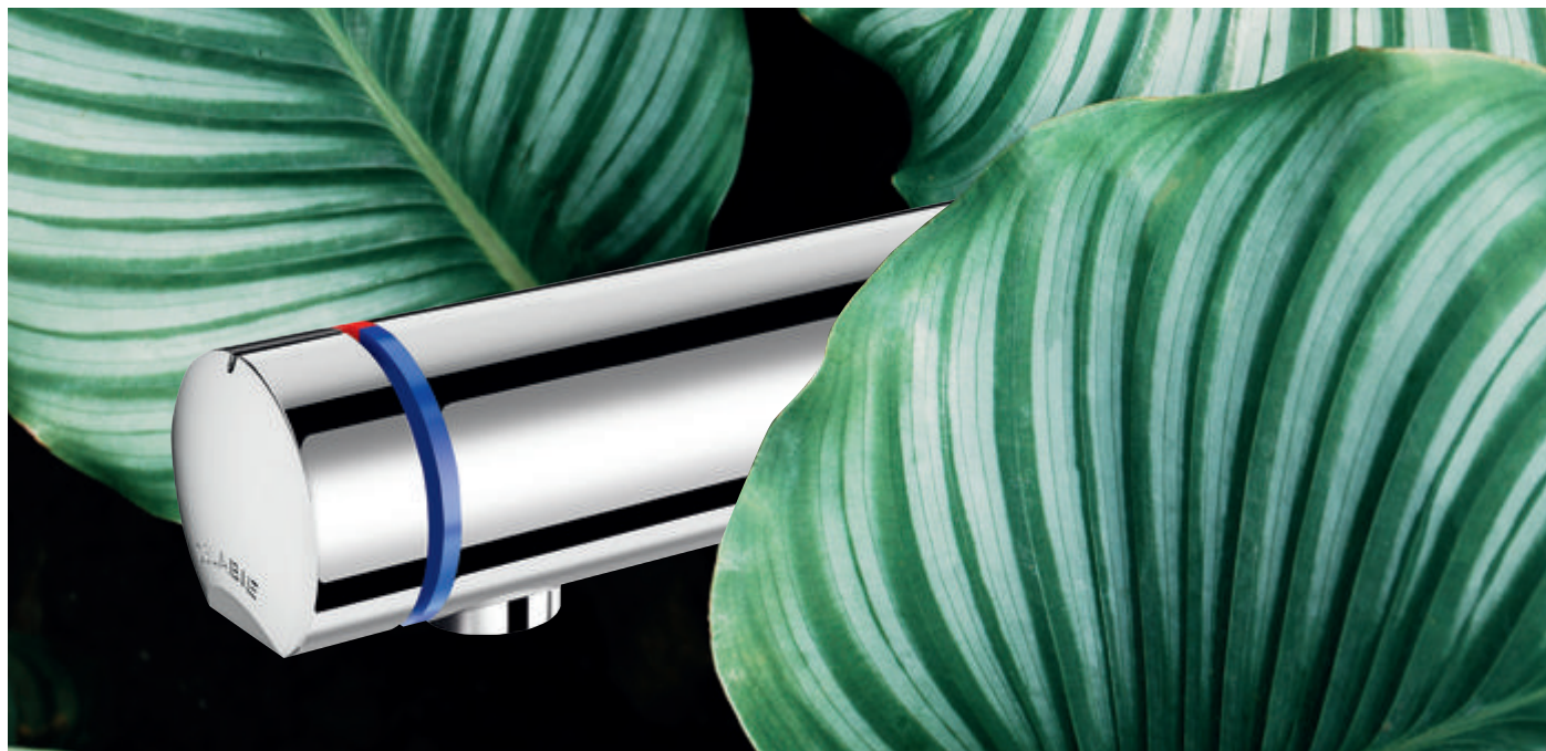
Mitigeur temporisé de lavabo mural TEMPOMIX 3, réf. 794050