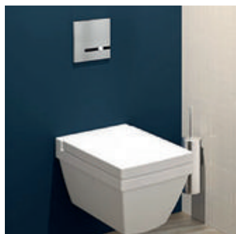
Robinet de chasse directe BICOMMANDE

80 % d'économie d'eau et aucune consommation d'énergie Réf. DELABIE : 714700