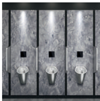
Robinet électronique d'urinoir TEMPOMATIC 4

Rinçage "intelligent" : distingue la nécessité d'un petit ou gros volume de chasse. Réf. DELABIE : 464PBOX+464006