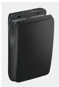
SPEEDJET 2 noir mat. Réf. : 510624B

Afin de lutter contre le vol, très fréquent en collectivités, ce nouveau sèche-mains est doté de vis antivol.