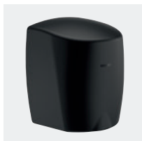
Sèche-mains à air pulsé HIGHFLOW noir mat