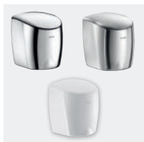
HIGHFLOW existe en finition poli brillant, poli satiné et blanc