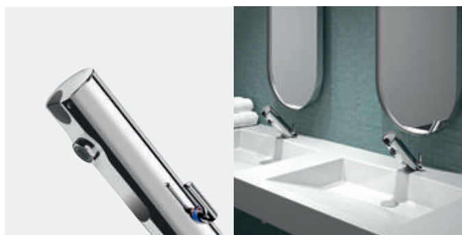
Mitigeur électronique de lavabo TEMPOMATIC 4 Réf. 490000

Illustrations disponibles sur notre site internet delabie.fr :