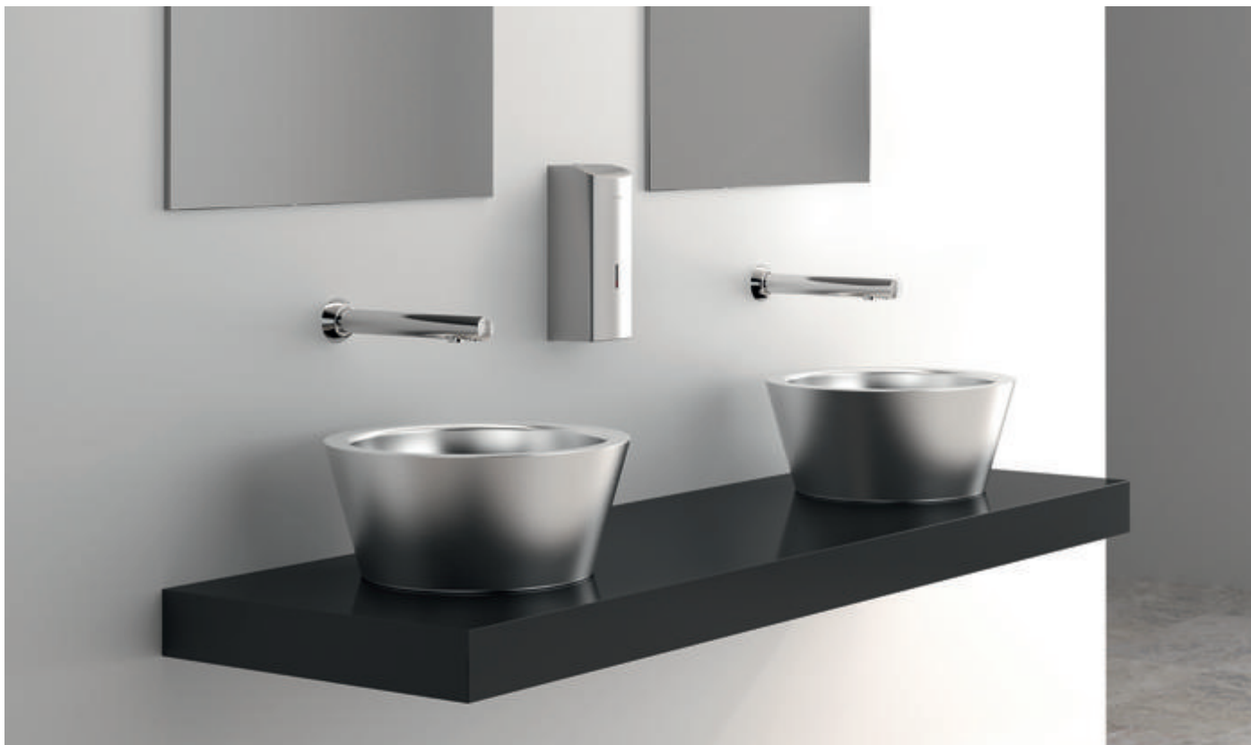
Vasque à poser Inox ALGUI - réf. 120110, Robinet électronique BINOPTIC - réf. 379ENC, Miroir rectangulaire Inox - référence réf. 3459 et Distributeur électronique mural de savon liquide Inox 304 - réf. 512066S

Dans le contexte actuel de pandémie, le lavage et la désinfection des mains sont au cœur des préoccupations des utilisateurs des sanitaires dans les lieux publics. L'hygiène doit être maximale et les solutions sans contact sont très recherchées. Mais le respect strict du premier geste barrière contre la propagation des virus va de pair avec une forte surconsommation d'eau et d'énergie. Plus que jamais, installer des équipements sanitaires intégrant de nombreuses fonctionnalités adaptées aux lieux publics, est incontournable.