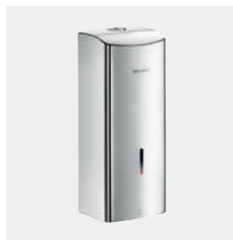
Distributeur électronique de savon liquide ou gel hydroalcoolique Réf. 512066P