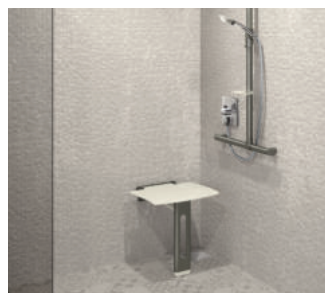
Exemple d'installation, Siège de douche rabattable Be-Line® avec pied, anthracite métallisé Réf. 511930C