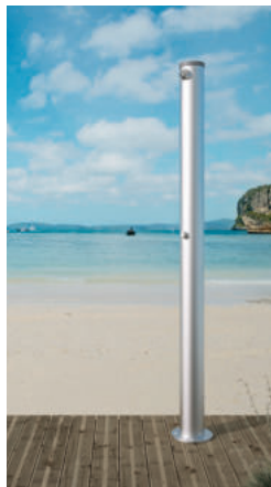
Exemple d'installation de la colonne de douche PLEIN AIR

Illustrations disponibles sur notre site internet delabie.fr , rubrique Presse