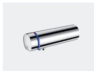
TEMPOMIX 3 (arrivées d'eau encastrées) L.110 Réf. 794050

Le PLUS X AWARD est le plus grand prix d'innovation au monde dans les domaines de la technologie, du sport et du mode de vie. Il récompense les marques qui se distinguent par la qualité et l'innovation de leurs produits. Un jury d'experts indépendants, représentant différents secteurs d'activité, attribue les labels de qualité du prix d'innovation : Innovation, Design, Haute qualité, Facilité d'utilisation, Fonctionnalité, Ergonomie et Écologie. Cette approche du PLUS X AWARD est unique. Ainsi, les labels de qualité du PLUS X AWARD constituent une référence des meilleurs produits et un signe indéniable de la qualité d'une marque.