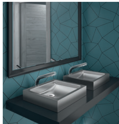
Exemple d'installation Vasque design Inox UNITO