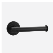
Porte-papier toilette à rouleau ou de réserve