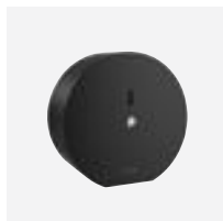
Distributeur de papier toilette