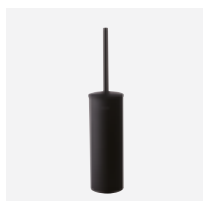
Porte-balai avec brosse WC et couvercle