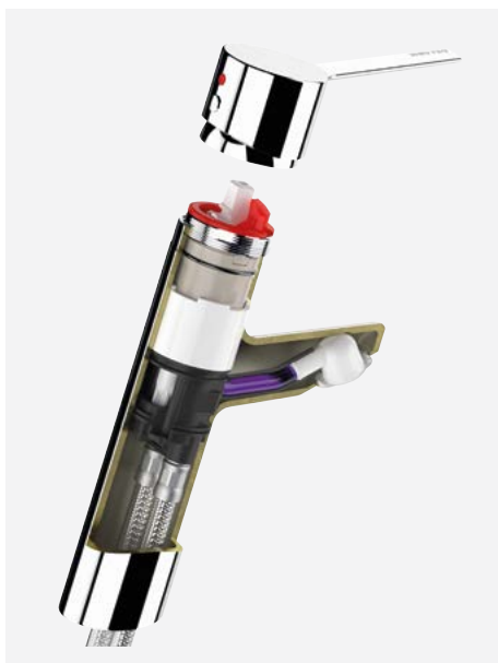
Coupe 2921TEP : faible volume d'eau, technologie EP, fonction choc thermique Réf. DELABIE : Coupe3D_2921TEP