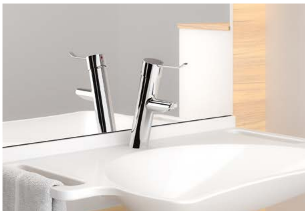
Mitigeur mécanique à équilibrage de pression - levier Hygiène Réf. DELABIE : 2921LEP

Le mitigeur mécanique 2921LEP n'est pas un robinet ordinaire. Imaginez un produit qui combine à la fois hygiène, sécurité et confort d'utilisation. Et bien, c'est exactement ce que ce mitigeur apporte ! Il ne se contente pas de répondre aux contraintes des établissements de santé et aux besoins des patients, il les redéfinit complètement : avec son bec équipé d'un petit tube, sa technologie à équilibrage de pression et sa fonction choc thermique sans nécessité de démontage du levier. Le mitigeur 2921LEP est une véritable révolution dans le domaine des équipements sanitaires. Garantie 30 ans.