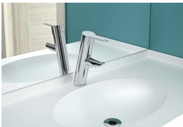
Mitigeur mécanique à équilibrage de pression - manette pleine Réf. DELABIE : 2921TEP