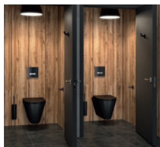
Exemple d'installation, système de chasse directe TEMPOFLUX 3 WC Réfs. 763BOX + 763030

Aussi performant que beau, le système de chasse d'eau sans réservoir TEMPOFLUX 3 WC coche toutes les cases pour des Lieux Publics hors du commun !