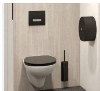
Exemple d'installation, système de chasse directe TEMPOFLUX 3 WC Réfs. 763BOX + 763030