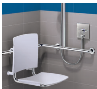
Exemple d'installation du mitigeur de douche thermostatique encastrable Réf. H96CBOX-H9633