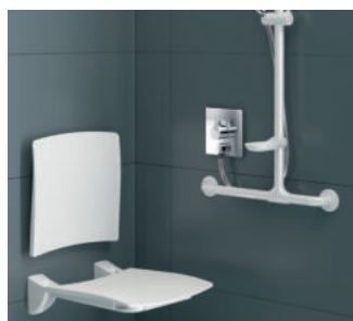
Exemple d'installation du mitigeur de douche thermostatique encastrable Réf. H96CBOX-H9633

La mention «Meilleur produit de l'année» permet de mettre en avant le produit qui a reçu le plus de labels dans sa catégorie par rapport à la concurrence. C'est une distinction supplémentaire pour le produit concerné : un moyen encore une fois de récompenser la haute qualité, la facilité d'utilisation et la fonctionnalité.