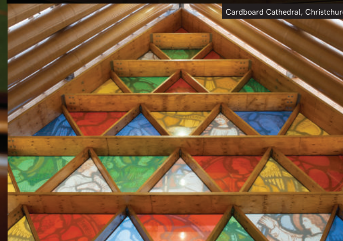
Cardboard Cathedral, Christchurch