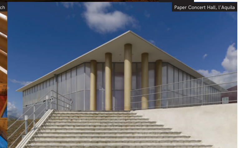
Paper Concert Hall, l'Aquila